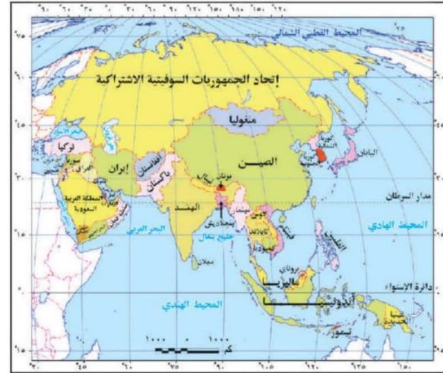
خريطة (١) آسيا قبل تفكك الاتحاد السوفيتي في ديسمبر ١٩٩١م