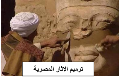
ترميم الاثار المصرية

- دراسة التاريخ وتحقيق مبدأ التعايش السلمي وتقبل الاخر