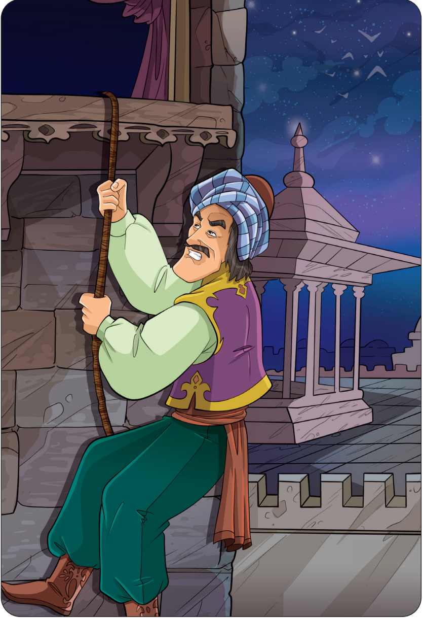
القاضي بدر الدين يدلى بالحبال من سور القلعة