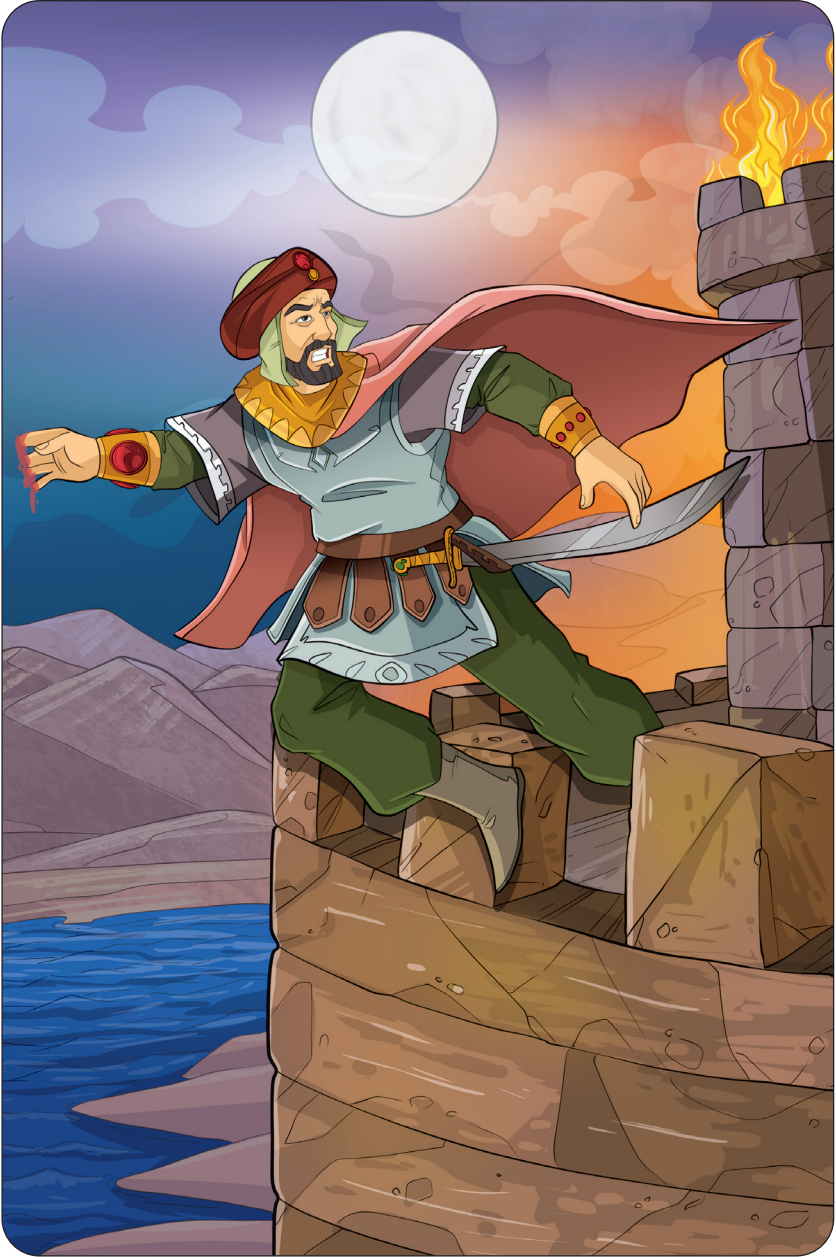
توران شاه يهيم بالقاء نفسه فى النيل هرباً من النيران